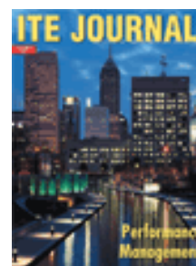
El ITE Journal es un gran foro de discusión y información técnica

Para más información sobre la membresía del Instituto acceda http://www.ite.org bajo la sección Join ITE Today! .