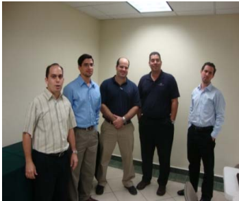
Junta Directiva Interina encargada del proceso de Reactivación de la ITE Sección de Puerto Rico

La reactivación de nuestra Sección de la ITE se hará una realidad gracias al interés y empeño de un creciente grupo de miembros y otros profesionales de la transportación. Lo que