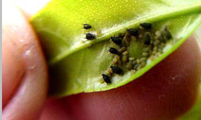
Áfidos debajo de una hoja

Los áfidos se alimentan de las hojas, los renuevos, las flores, los frutos, las ramas, los tallos y las raíces de una gran diversidad de plantas, árboles y arbustos. Altas poblaciones de estos insectos causan que las hojas jóvenes, los renuevos y las flores se arruguen o enrosquen. Su ataque ocasiona que se agudicen los síntomas de la marchitez en tiempos de sequía y que las plantas, los árboles y los arbustos se vean deslucidos. Una población alta de áfidos puede retrasar el crecimiento