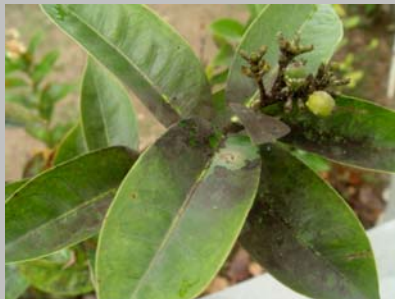
Hojas con fumagina o moho de hollín.