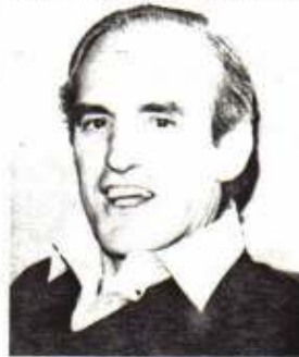
Ignacio Ellacuría, S.J. 9, XI, 1930 - 16 XI, 1989

Felices los que tienen hambre y sed de justicia, porque serán saciados.